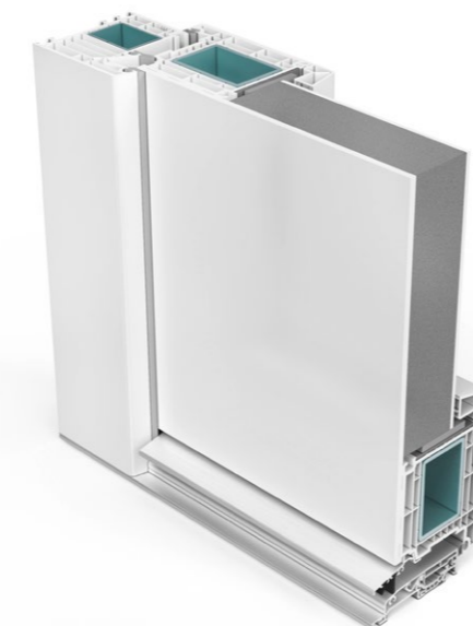
Für Haustüren mit flügelüberdeckenden Füllungen und einer durchgängigen Außenfläche ohne störende Schattenfugen bietet das System SOFTLINE 82 ein speziell entwickeltes Flügelprofil

Mit SOFTLINE 76 und SOFTLINE 82 hat VEKA zwei hochwertige Haustürsysteme im Programm. Die wichtigsten Eigenschaften einer modernen Haustür werden nachfolgend beispielhaft am System SOFTLINE 82 dargestellt.